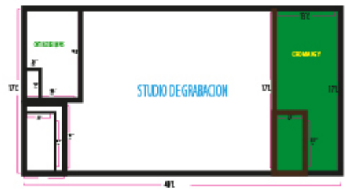
VISTA LATERAL DE LOS ESTUDIOS #2 (1ery 2do PISO)